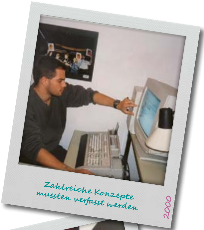
Zahlreiche Konzepte mussten verfasst werden