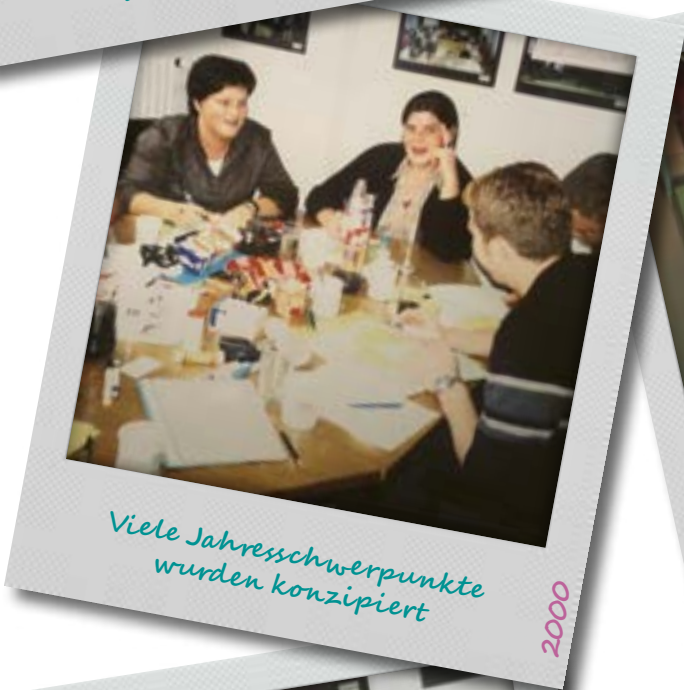
Viele Jahresschwerpunkte wurden konzipiert