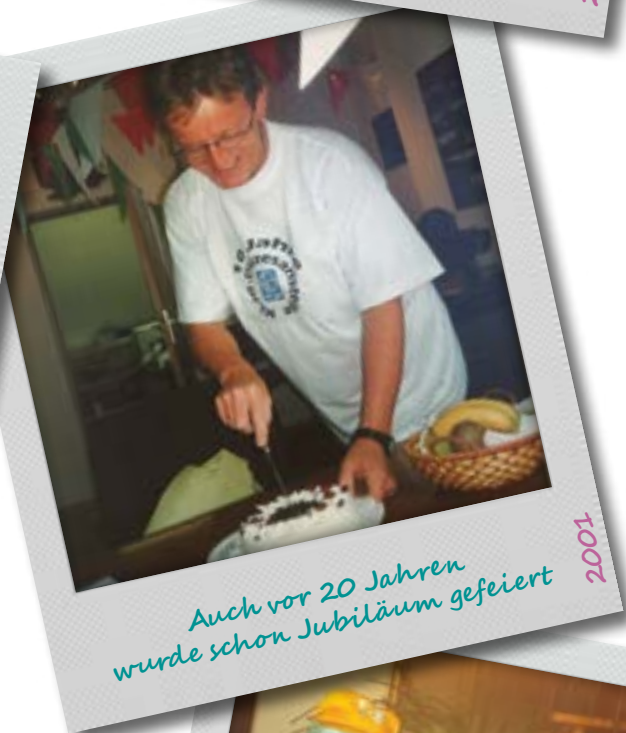
Auch vor 20 Jahren wurde schon Jubiläum gefeiert