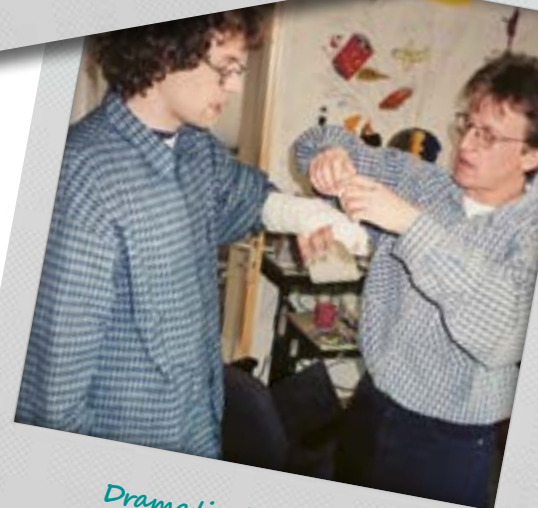
Dramatische Szenen spielten sich ab