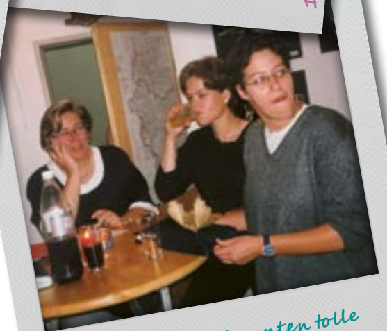
Immer wieder konnten tolle Aktionen gefeiert werden