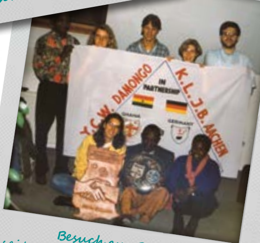
Besuch aus Ghana seit 1984 gab es da ein Brunnen- bauprojekt (& einen eigenen AK)