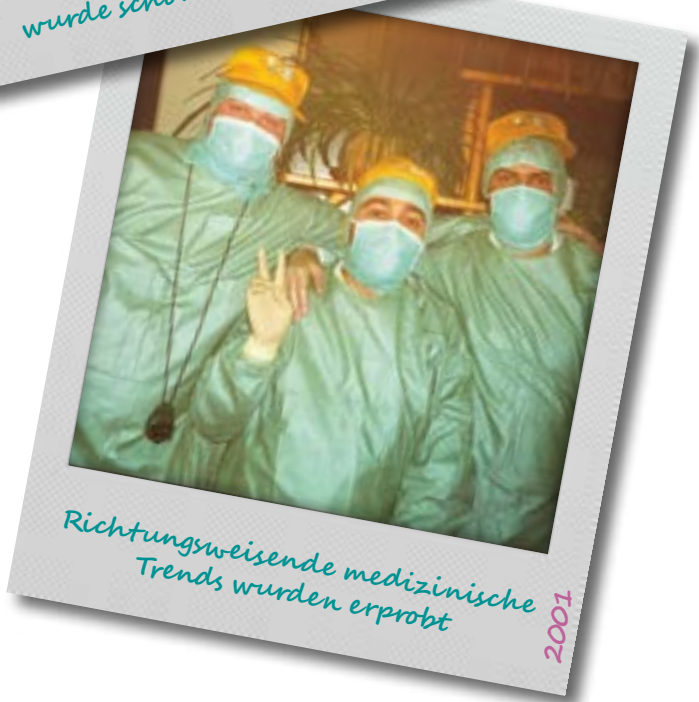
Richtungsweisende medizinische Trends wurden erprobt