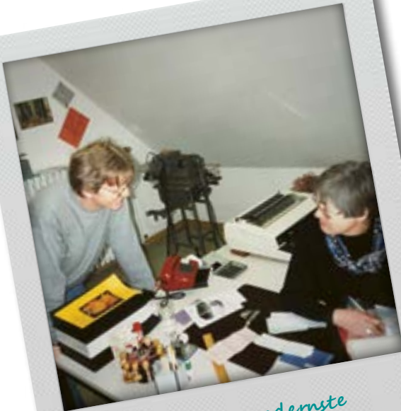
Immer die modernste technische Ausrüstung ;-)