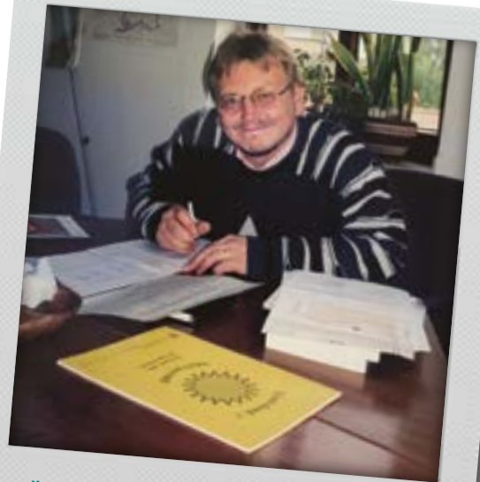
Über Jahrzehnte entstand hier die Erntedankmappe