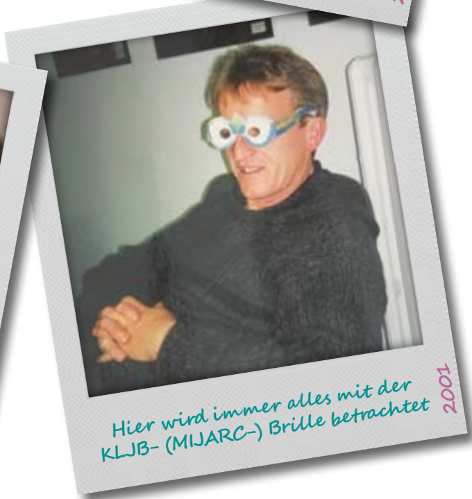
Hier wird immer alles mit der KLJB- (MIJARC-) Brille betrachtet