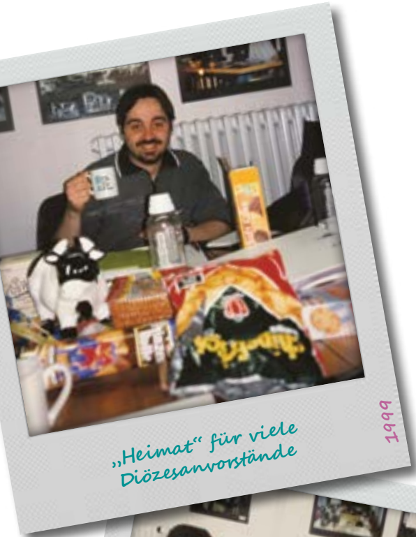
„Heimat“ für viele Diözesanvorstände